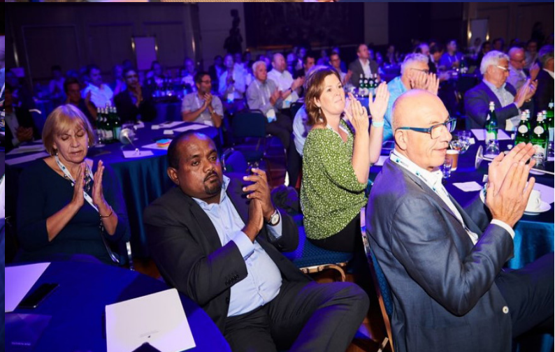
Conferencia Internacional de Moore Global - Roma 2019