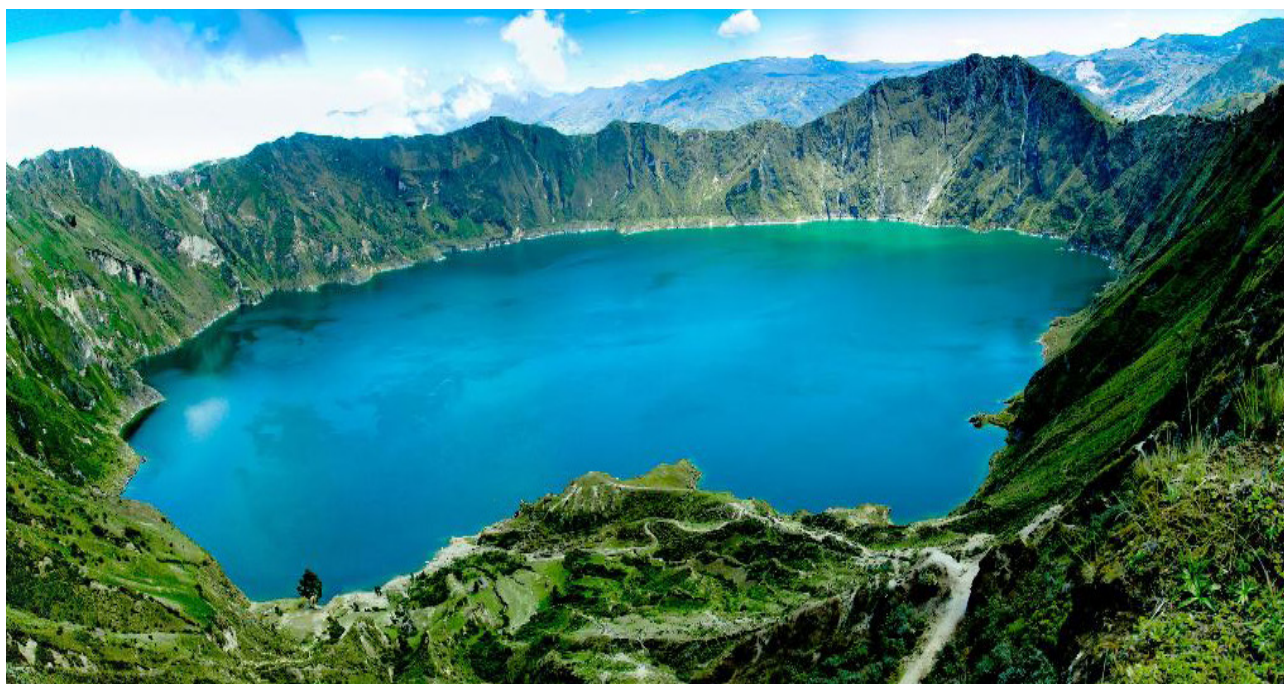
Laguna de Quilotoa - Ecuador

Una política de puertas abiertas ayuda a identificar los problemas que de otro modo pueden pasar inadvertidos. Esto permite a los empleados tener acceso directo a los altos ejecutivos.